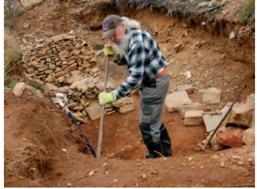
ja Karin monttu.

metrin päässä Puskuojan uomasta täysin kiualla kannaksella. Edes pohjasta ei puske monttuihin vettä. Heidän pysäkillen Puskun mutkassa, pari kilometriä legendaarisesta Tivolikämpästä alavirtaan on muodostunut jonkinlainen muinainen harjurakenne, johon kulta on rikastunut. Kultaa on heti pinnassa kunnan alta, välissä kullaton välikerros ja varsinainen rikastuma kivisessä kerroksessa syvemmällä.