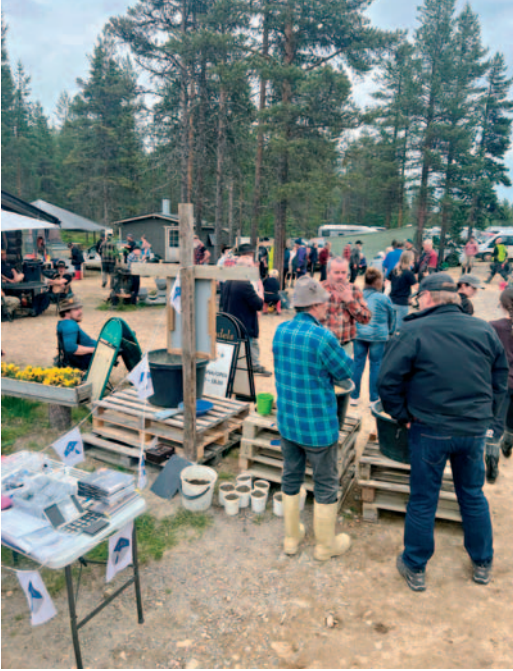
Liiton pop up-palvelupiste Kutturin Kultakisoissa.

joka jelppi monessa kohtaa alkutaipaleella ja sai alun perin minut hakemaan tätä mukavaa kesätyötä ja uskomaan, että teen sen parhaalla osaamisellani.