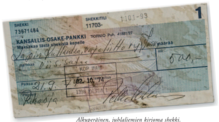
Alkuperäinen, juhliemien kirjoma shekki.