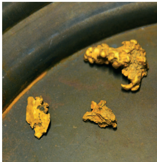
28,9-grammainen Varpu-hippu ylinnä oikealla. Vasemmalla Siloposki ja keskellä Pikkuveli.