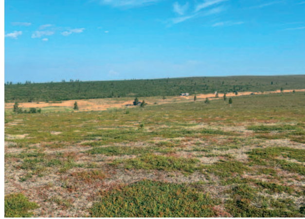
Maisemoitua Ylä-Miessin maisemaa Lemmenjoella Pihlajamäestä ylävirtaan.

Parhaimpia hetkiä koin, kun uusia nuoria jäseniä liittyi mukaan jatkamaan kultaperinnettä Lapissa. Heitä liiton valtauksilla oli myös vanhempinsa opissa. Moni vanha jäsen luopui jäsenyydestä terveyden ja iän tuomien esteiden takia. Kädyt puhelut heidän kanssaan olivat opettavia ja kannustavia. Sain kuulla monta mukavaa tarinaa. Vahva viesti oli ”Lapin kultaperinteen pitää jatkua”. Siinä nuoremmille viestikapula ja mietinnän aihe, miten liitto toimii ja tukee kullankaivajaa jatkossa. Millaisia valtauksia, missä, kuinka monta. Uusia toimintatapoja. Miten kehitetään liittoa, jotta se palvelisi kaikkia tasapuolisesti.