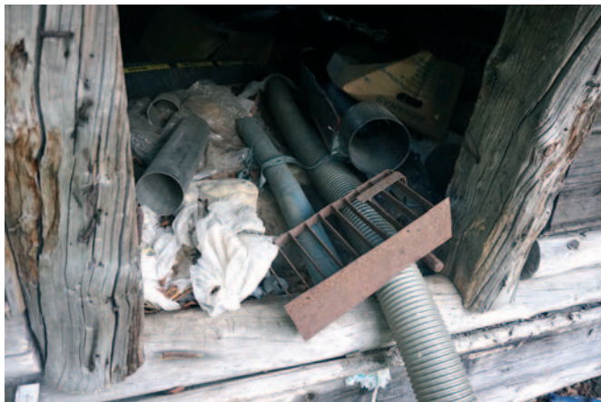
Kämpän vintillä lujuu sinne säilöttyjä ja unohdettuja imurilaitteen osia.