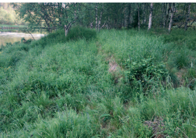
Kasvimaan pengerrykset erottuvat niukasti. Sarat ovat vallanneet entisen peruna- ja juuresmaan.