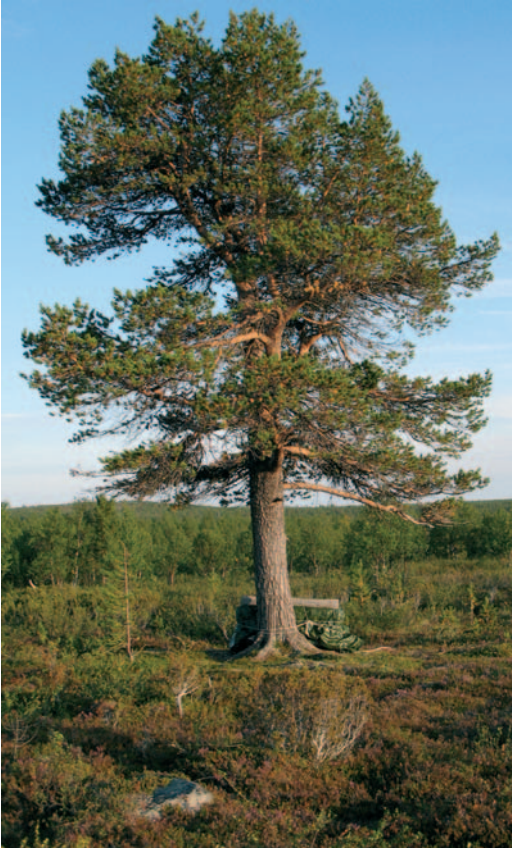
Osuuskaupan mänty elokuussa 2006.

matkattiin liki joka kesä kymmenisen vuotta. Kullanhuuhdonnan eri työvaiheet tulivat tutuksi, ja jonkin verran kultaa kertyi muistoksiin. Sain olla mukana paitsi montulla, myös ohituskanavan ja kenties valtauksen kaikkein tärkeimmän rakennelman, vessan pystyttämässä.