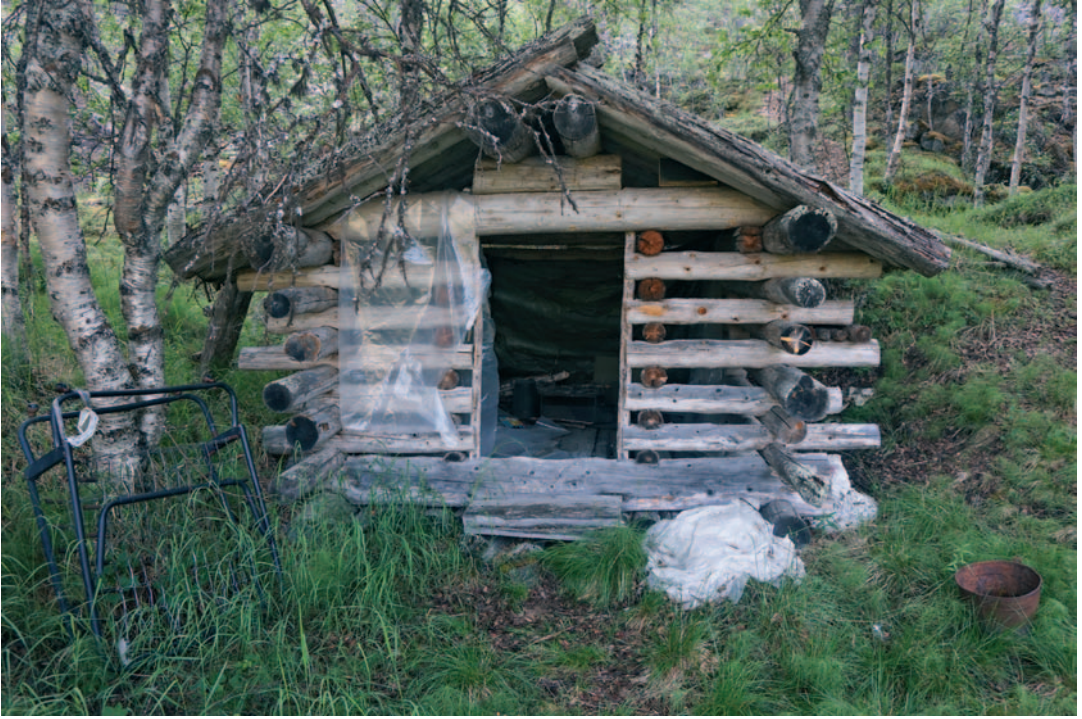
Latotyypinen puuvaja on muutettu muoveilla, pressuilla ja kamiinalla väliaikaiseksi metsästysmajaksi. Nyt muovit repalehtivat tuulella.