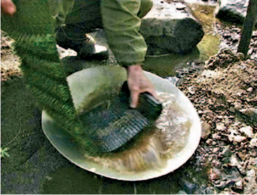
Ruohomaton tyhjennyspesu täydessä käynnissä. Jalkarauta paljastaa pyykkärin.