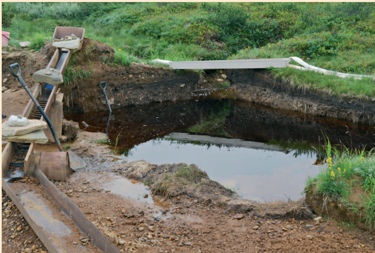
Öinen rankkasade ja sen yläjänkältä keräämä ullivesi ovat vallanneet kullankaivajan montun.

Tukes kannustaa kaikkia luvanhaltijoita omaksumaan sähköisen raportoinnin geotietovirta-sovelluksen kautta. Palvelu löytyy osoitteesta geotietovirta.tukes.fi .