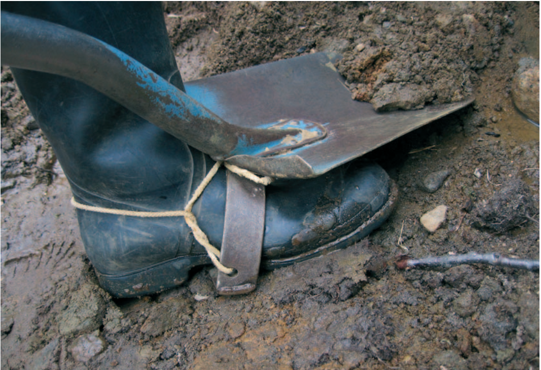
Vallu käytti montulla jalkarautaa tehostamaan kivien irrottamista ja suojaamaan jalkaterää.

Vallu itse kiinnostui kullasta lopulta niin paljon, että hän lähti opiskelemaan kultasepän ammattia Lahteen ja valmistui vuonna 1995 kultaseppämestariksi. Kesäinen piipahdus Aatoksen luona johti siis lopulta uuteen ammattiin. Kullankaivu ja uusien kaivajien opastaminen on jatkunut aina näihin päiviin asti.