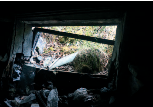
Ikkuna on hajonnut tai rikottu. Talven lumet pääsevät lahottamaan kämpän sisustaa.