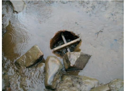
Montun viemäri kesäkuun alussa 2006. Montun tyhjennys huuhdelti putken tehokkaasti.

Oja padottiin ja suurin osa vedestä ohjattiin ohituskanavaan. Osa ohjattiin pitkän muoviputken avulla rännille. Veden määrää säädeltiin padolla olleen levyn avulla, jolla voitiin