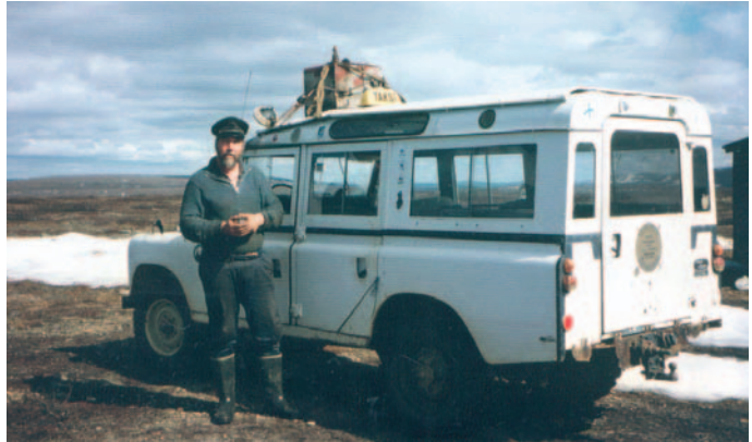
Riston huumoria; taksinkuljettajan koppalakki, taksikilpi ja ”se kuuluisa musta laatikko”.

ään Karhu-Korhosen kirjastona. Risto ajoi paikalle vanhalla valkoisella YK-maastoautolla, jonka ovissa on Kaivosyhtiö Kultakuokan logo ja katolla keltainen Taksi-kilpi. Katolla on myös iso ruma peltilaatikko, josta joku turistikin oli kysellyt ja saanut Ristolta vastaukseksi, että ”se on se kuuluisa musta laatikko”. Poltto-