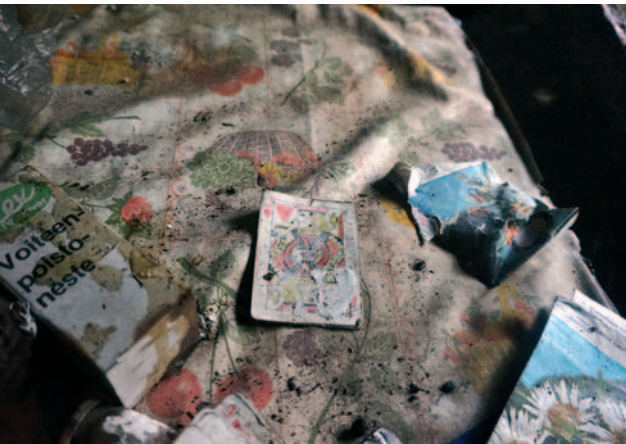
Vabakantisella pöydällä lojuu voiteenpoistorasia, kukkien siemenpusseja ja herttajätkä – kuin Unto itse – keskellä hävitystä.