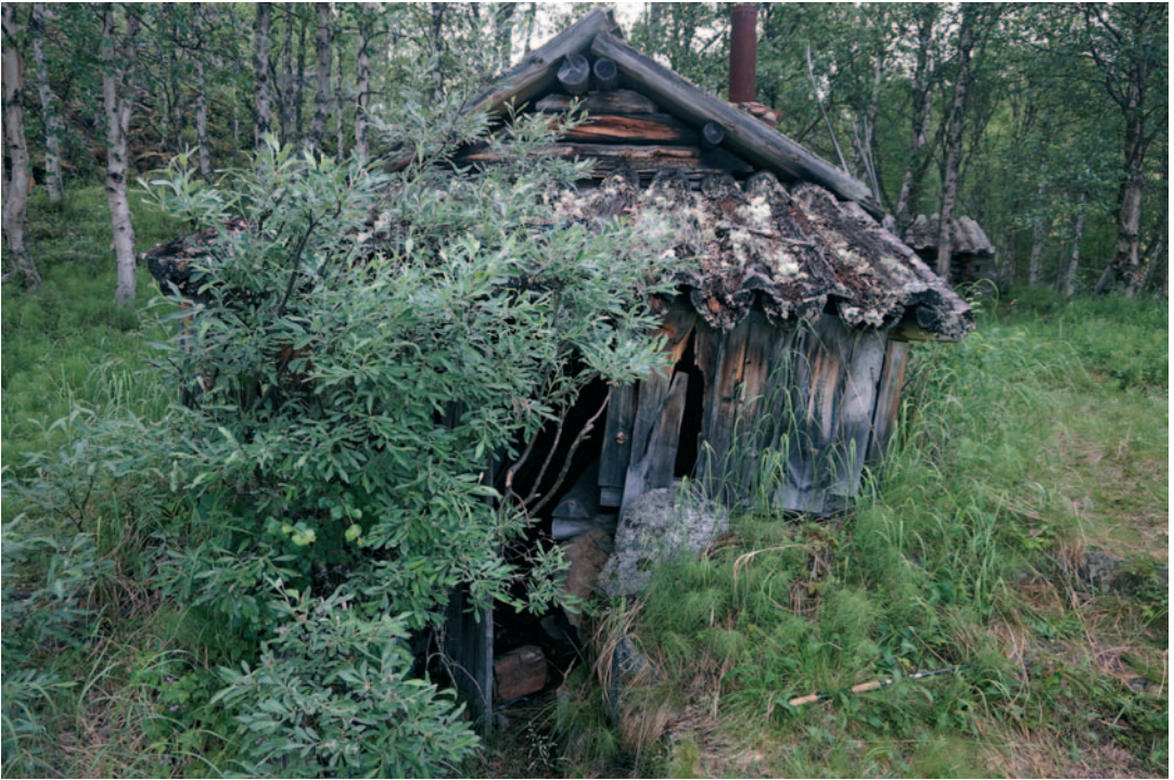
Korsukämpän eteisosan kellekset ovat sortumassa, ovi rikottu ja tavaroita levitetty. Ripeikasvuinen paju suojaa oviaukkoa.

levitetty hujan hajan. Vaikutelmaksi jäi kuin vierailulla olisi käynyt kumivenekaupalla reippaita ja asiansa taitaneita huligaaneja.